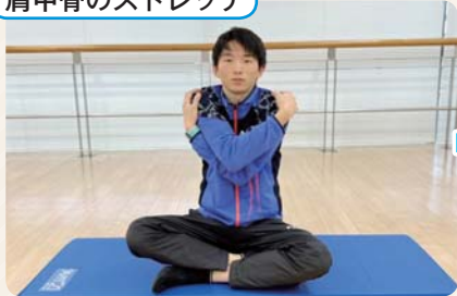
① 両手を交差して、肩に手をおく。