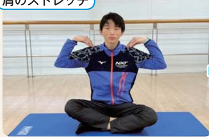
① 肩に手をあて、大きく回す。