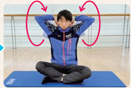
② 肘で大きな円を描くイメージで行う。反対回しも行う。