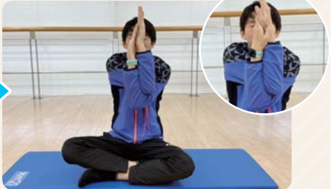
② 腕を絡ませていく。腕を入れ替え、反対も行う。