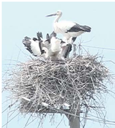
親鳥が交互にひなに餌を運ぶ

※昭和46年に野生下、昭和61年に飼育下のコウノトリが死亡し、日本産コウノトリは絶滅。昭和60年以降、兵庫県が旧ソビエト連邦のコウノトリから人工繁殖・放鳥を進め、近年、生息数は増加しています。令和4年6月30日時点で、国内野生推定個体数は271羽。