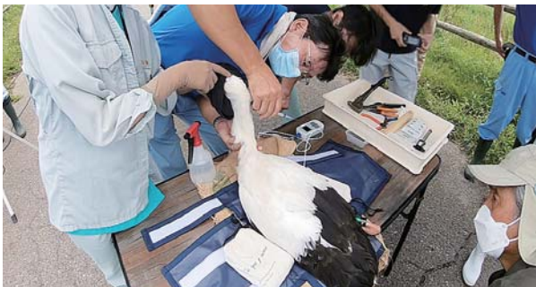
血液・羽毛の検体採取で雄雌の判断ができます

順調に成長すれば、7月下旬から8月上旬に巣立ちを迎えます。 ひなには近づかず静かに成長を見守ってください。