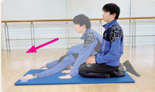
① 座った状態から、床に手をおき、息を吐きながら両手を前に伸ばす。