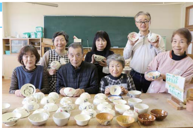
完成した酒器と陶芸教室の皆さん(志賀町工芸工房にて)

ピアラには、国交30周年マークを描いたほか、相撲や浮世絵など日本にちなんだ絵を描いたり、取っ手を付けたりと、ユニークな作品45点が約1カ月半かけて完成しました。ピアラは、10月下旬に、在日ジョージア大使館に発送しました。