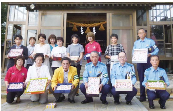
小浜神社で交通安全祈願祭に出席した皆さん