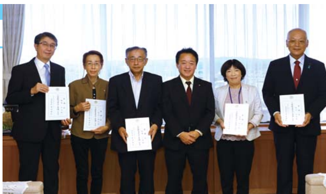
法務大臣から委嘱を受けた人権擁護委員の皆さん 人権に関する悩み事や相談に応じ、アドバイスします また、人権街頭啓発などさまざまな活動に参加しています