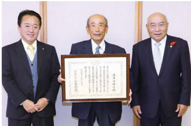
西海海晴会の橋本会長㊦と町老人クラブ連合会の干場会長㊦