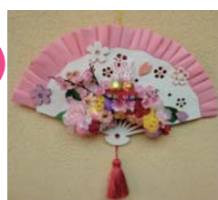
【作品サイズ】よこ約29cm×たて約24cm (タッセル長さ含) *写真はイメージです