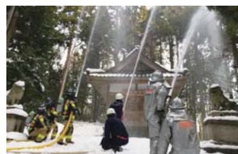
昨年1月の大杉神社(大笹)での訓練