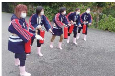
前浜女性防火クラブ

羽咋郡市広域圏事務組合消防本部では、宝くじの助成金で、訓練用消火器と標的を整備し、11月20日㊤、前浜女性防火クラブ主体で消火訓練を行いました。前浜区民27人が参加し、消防署から遠方に位置する前浜地区における初期消火の重要性を再認識するとともに、防火意識の向上を図ることができました。