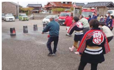
前浜区民による消火訓練