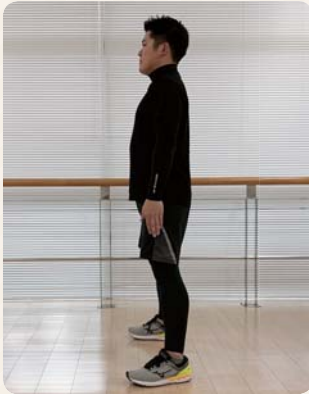
①肩幅に脚を開き、膝が前に出ないようにする。