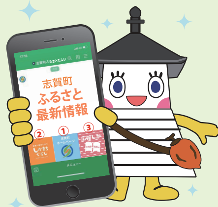
志賀町公式キャラクター：西能登あかりちゃん