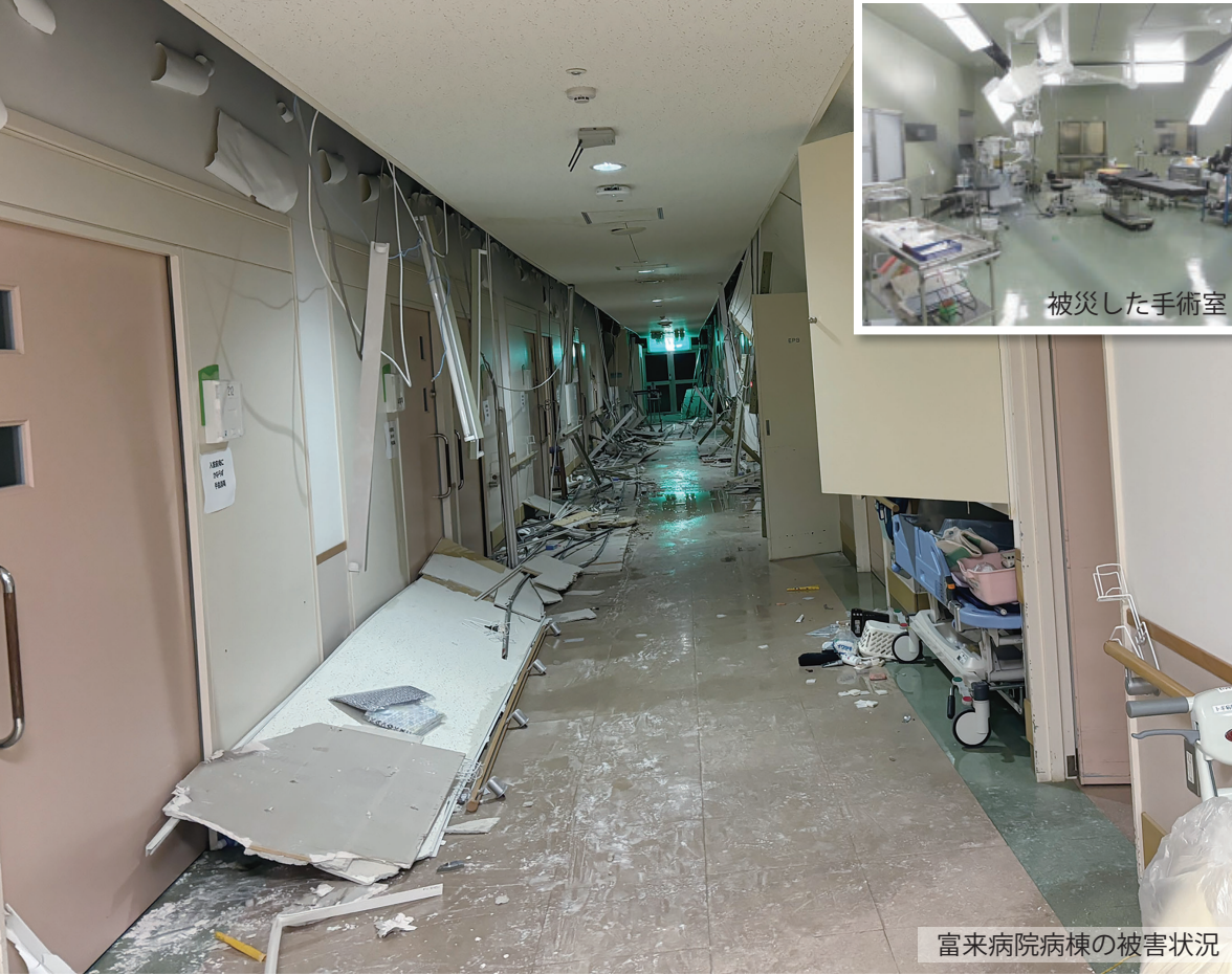
富来病院病棟の被害状況