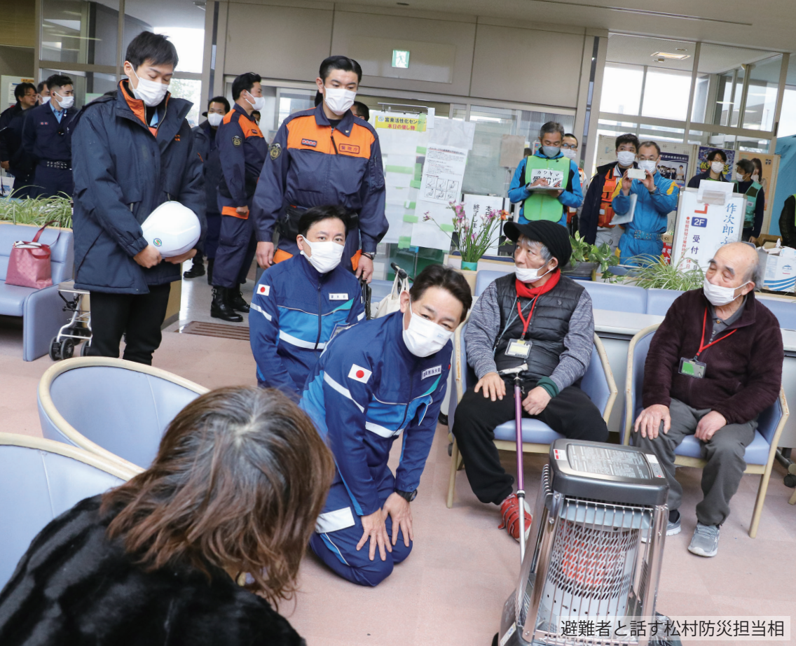
避難者と話す松村防災担当相