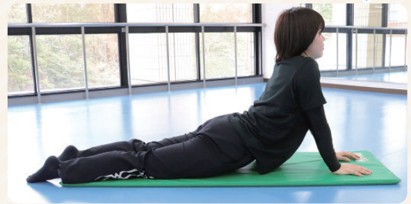
③ 余裕があれば、肘を伸ばして行く。