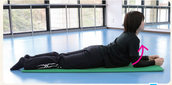
② ゆっくりとお腹を反らしていく。