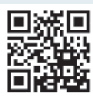
X (旧Twitter) @TownofShika