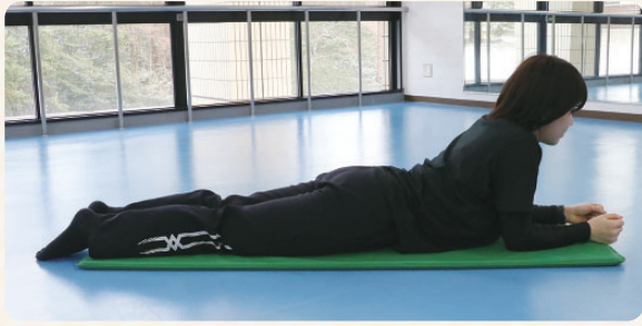
① うつ伏せになり、肘をつく。