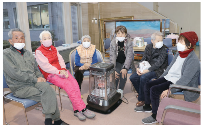
【避難所の富来活性化センター】

皆で励まし合いながら、明るく過ごしています。 県外の応援隊員や全国から届いた支援物資に感謝。