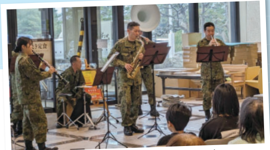
避難先での自衛隊の演奏。とても癒されました。 #志賀町から未来へ#震災復興