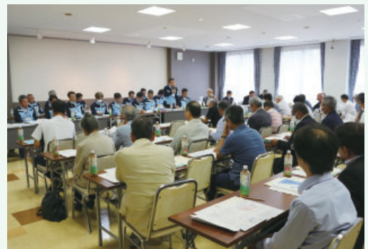
区長会研修会での説明