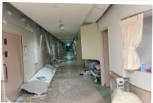
#志賀町から未来へ#震災復興