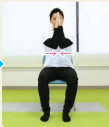
②左右の手を押し合いながら、脇を閉じていきます。