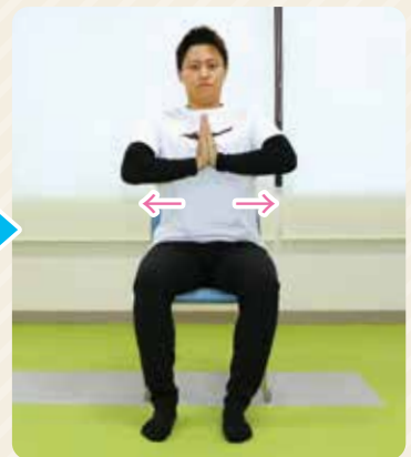
③肘と手首が水平になるくらいまで脇を開きましょう。 ①～③を繰り返しましょう。 (10～15回)