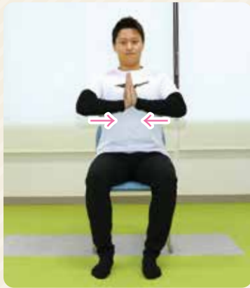
①背筋を伸ばして胸をはり、左右の手で押し合います。