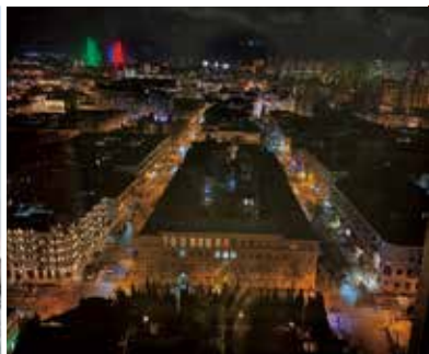
首都バクーの夜景