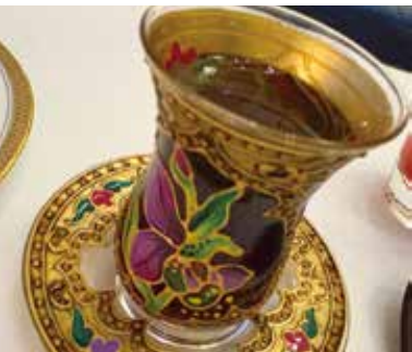
名産アゼルバイジャンティー