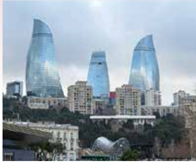
高さ 182 mの「フレイムタワーズ」