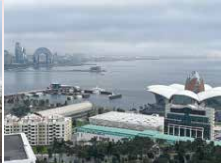
カスピ海を臨む首都バクー