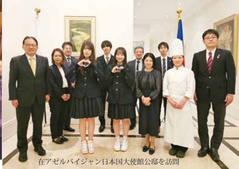
在アゼルバイジャン日本国大使館公邸を訪問