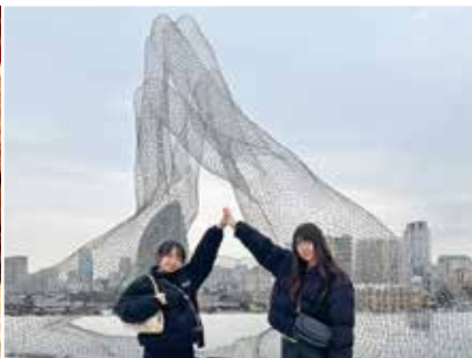
イタリアの彫刻家ロレンツォ・クインの作品前