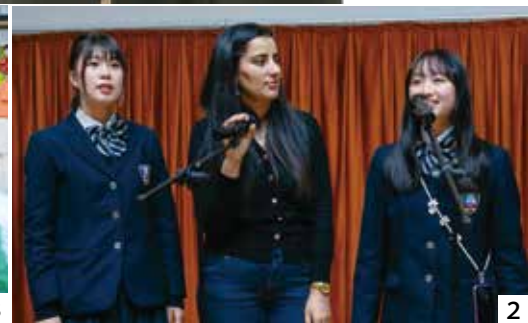
1-4_ 国立小中高一貫校で学生と交流し、2人は英語で志賀町や志賀高校を紹介した

私は2019年にアゼルバイジャンのレスリングチームが来町した時に交流はありましたが、実際にアゼルバイジャンを訪問するのは初めてでした。どんな国なのか興味と不安が入り混じる気持ちで飛行機に乗りました。実際に足を踏み入れると、人の温かさや美しい文化に心を奪われました。現地に到着した初日には、在アゼルバイジャン日本国大使館公邸を訪れました。豪邸が並ぶ住宅街に緊張しながらも、入ると大使館職員の皆さんが温かく迎えてくれました。伝統的な料理をいただきながら、アゼルバイジャンについて色々なお話を伺うことができ、これからの滞在がますます楽しみなものになりました。