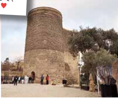
世界遺産「乙女の塔」