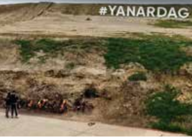
燃える丘「ヤナル・ダグ」