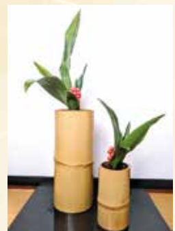
日野 敦子【古流】 花材：万年青(おもと)