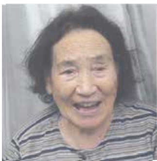
若い頃の好子さん