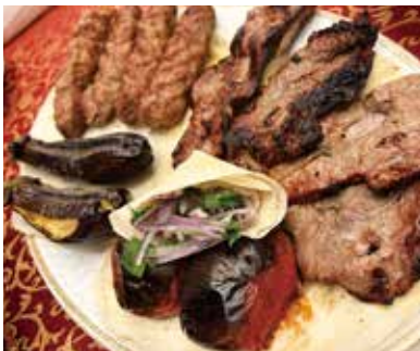
アゼルバイジャン料理「ケバブ」