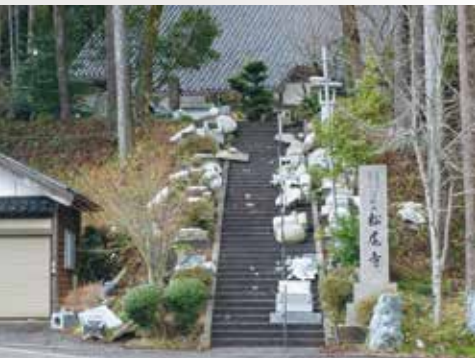
▲倒壊した松尾寺の石灯籠