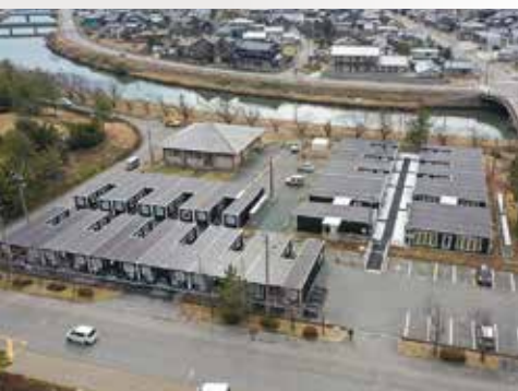
▲高浜町の応急仮設住宅「しか第2団地」

昨年元日に発生した「令和6年能登半島地震」は、町内全域で住家をはじめ、道路や上下水道、農業施設などの公共インフラや地域経済に甚大な被害を及ぼしました。 令和7年度予算は、昨年度に引き続き、災害復旧と被災者支援に係る経費を最優先としながら、昨年7月末に策定した復興計画に基づき、各種施策を推進していく予算編成を行いました。 その結果、一般会計の総額は、対前年15億円増の386億円、特別会計と企業会計を合わせた8会計の総額は、対前年37億7,750万5千円増の542億1,311万6千円となりました。