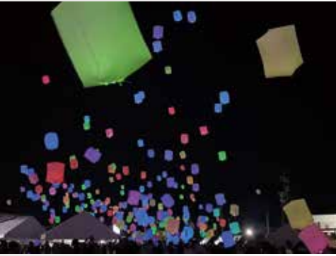
▲震災復興イベント「光の絆」で夜空を彩るスカイランタン®