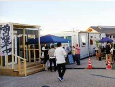
▲道の駅とき海街道前で営業する仮設店舗