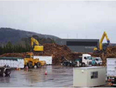
▲災害ごみが持ち込まれる富来野球場