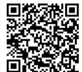
年度更新申告書 書き方パンフレット